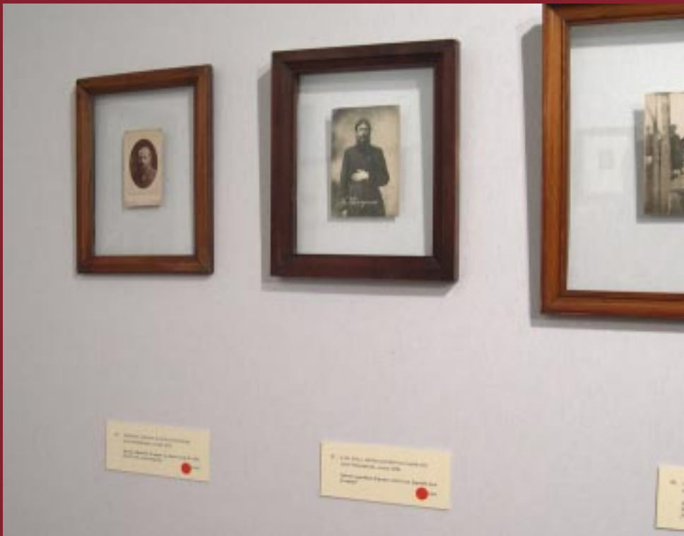
Po lewej zdjęcie Dostojewskiego, pośrodku – Rasputina.