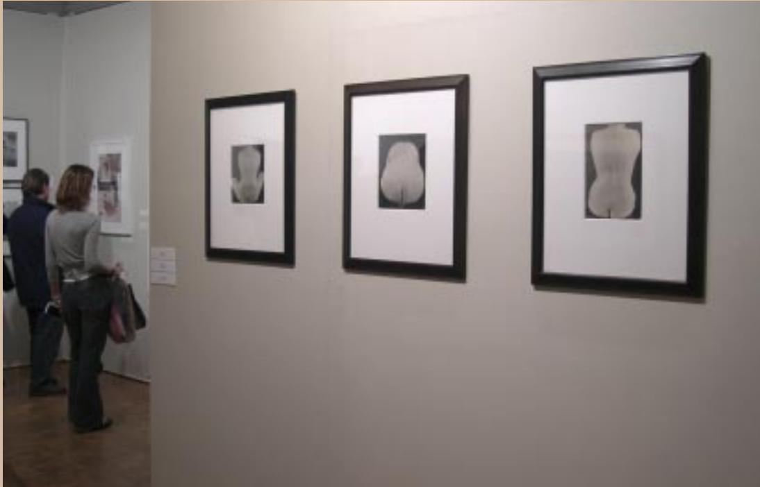
Akty Westona z lat 40-tych XX wieku.