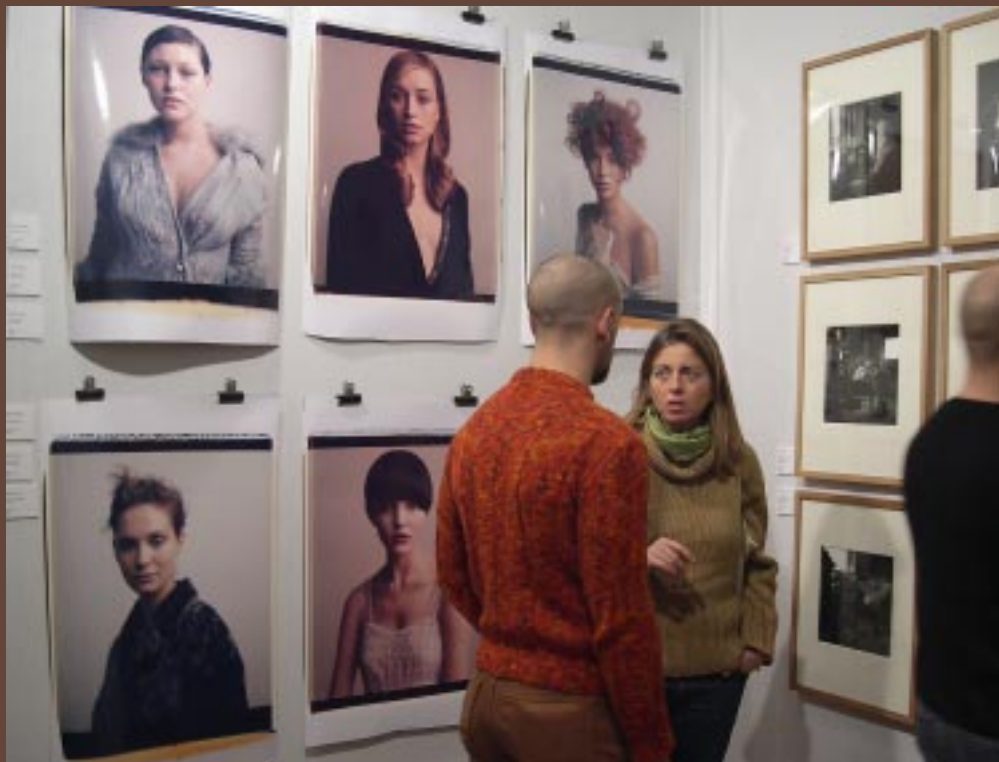
Trudna sztuka portretu III