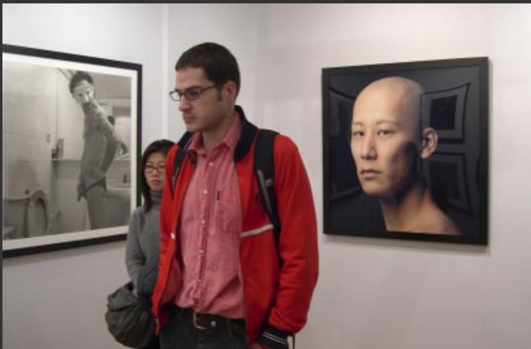
Trudna sztuka portretu I