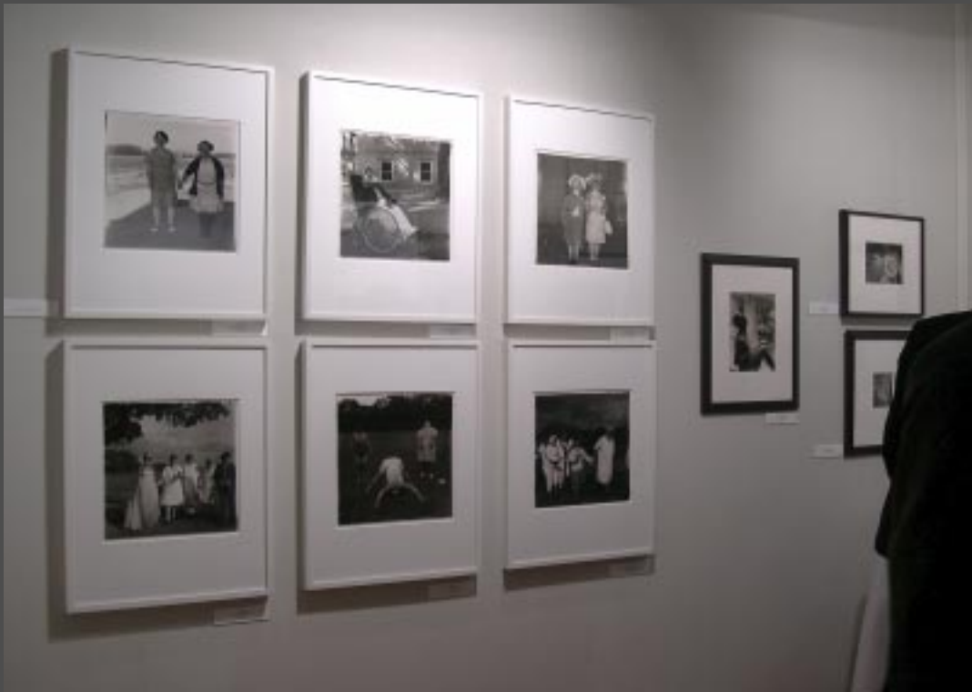
Zdjęcia Diany Arbus