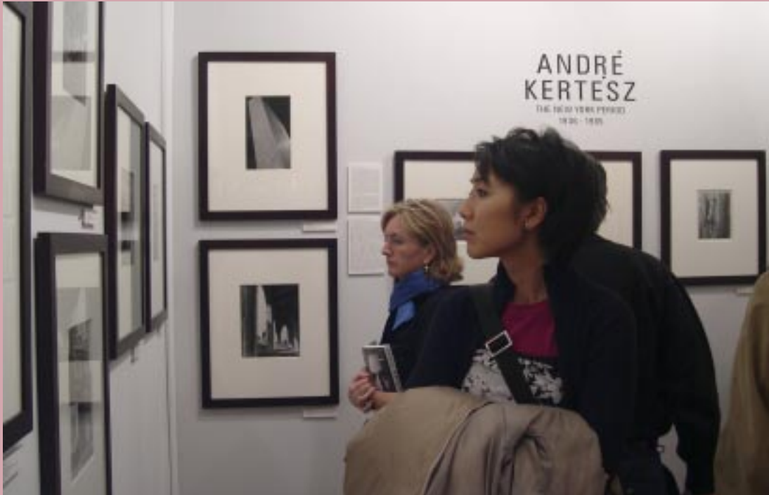
Zdjęcia André Kertesza z jego okresu amerykańskiego