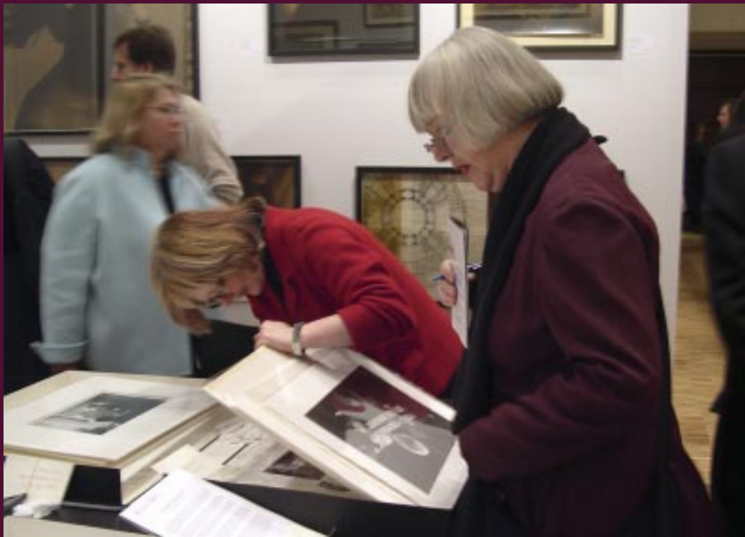
Galerzystka pokazuje zdjęcia kolekcjonerce