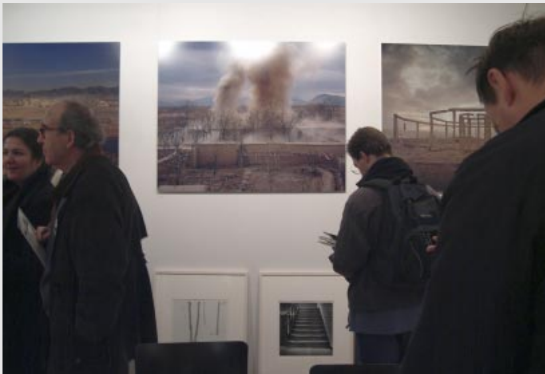
Zdjęcia z Afganistanu Simona Norfolkka