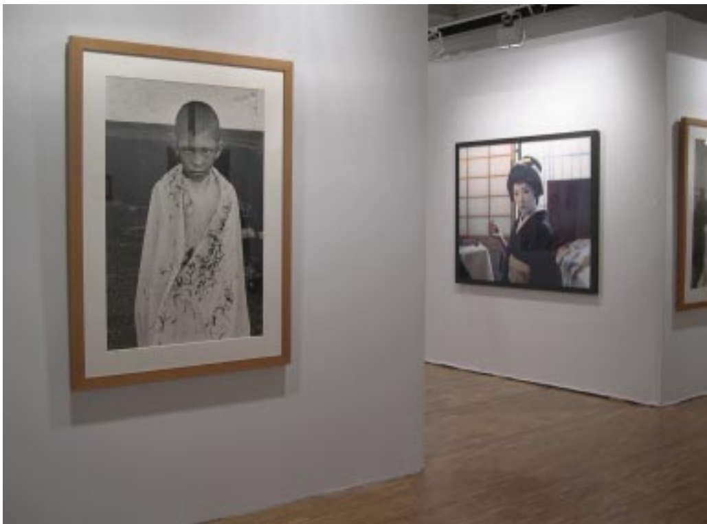
Trudna sztuka portretu II