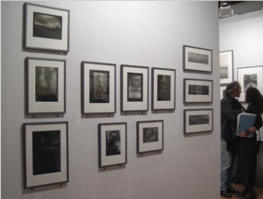
Leica Gallery z Pragi proponuje zdjęcia Józefa Sudka. ...