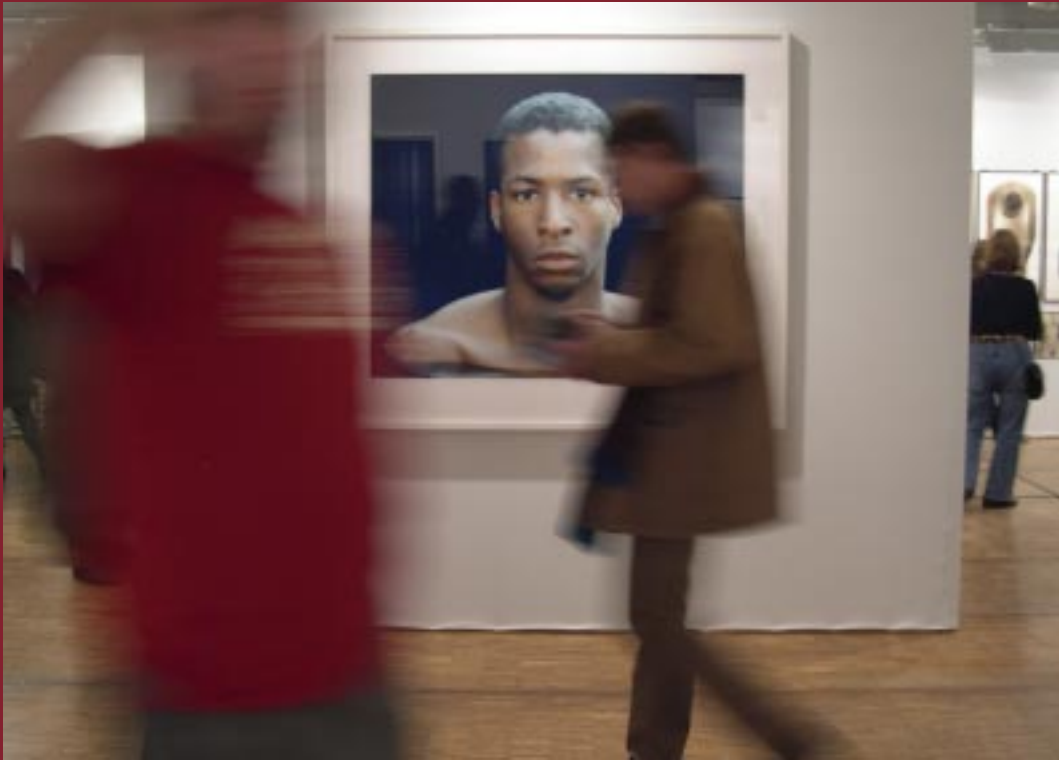
Trudna sztuka portretu IV