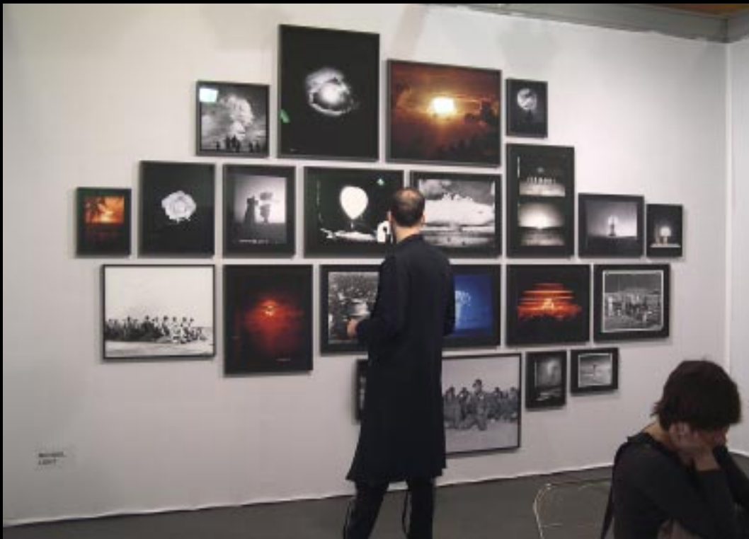
Naprawdę mocne uderzenie. Zdjęcia Michela Lighta próbnych wybuchów bomb atomowych